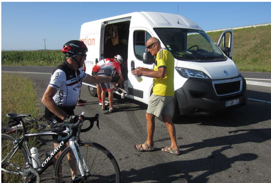
72 – Les champs de maïs approchent