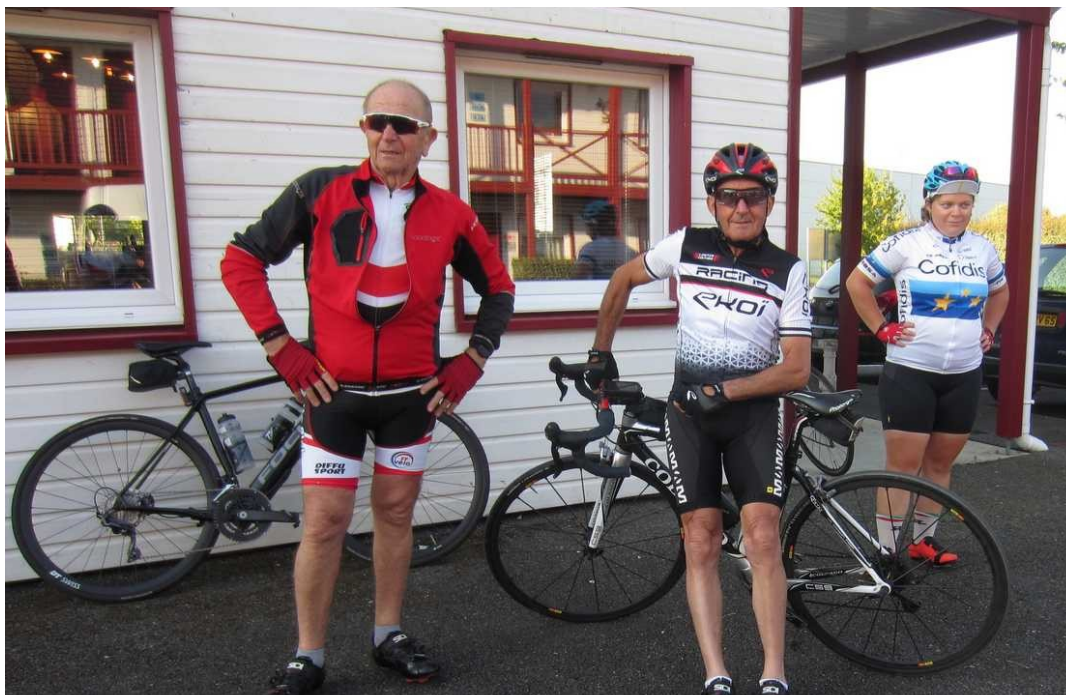
69 – Perdus dans le parking Leclerc de Tarbes