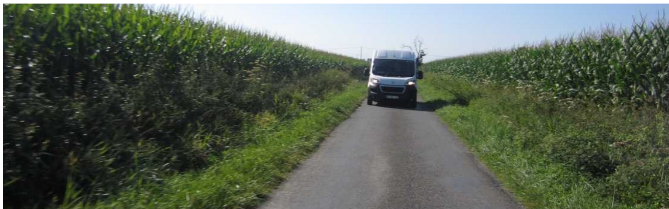
76 – Premiers coteaux