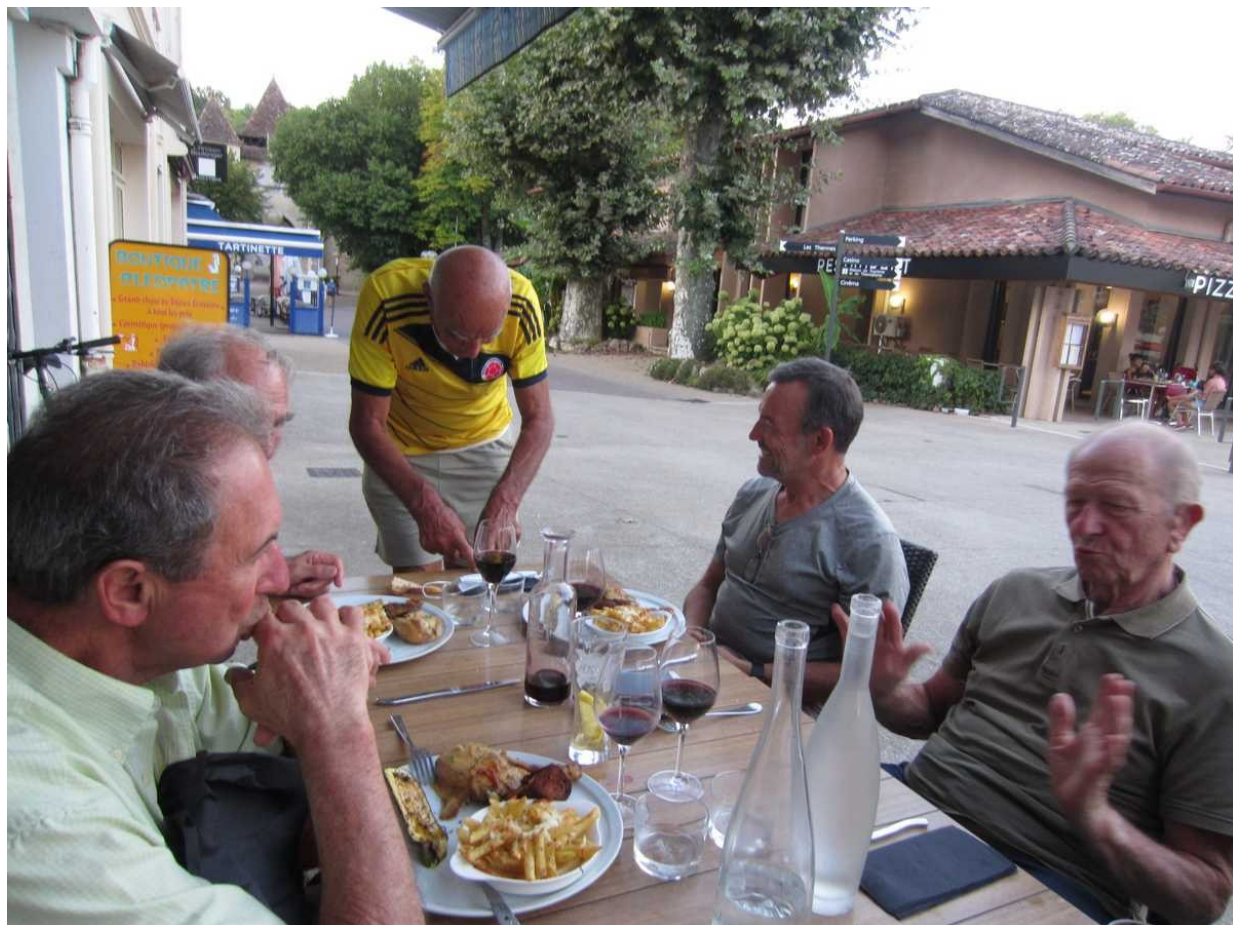
90 – On est bien servis